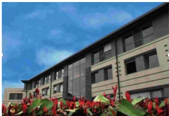
Siège social dans la région parisienne

Le service support intervient en niveau 1 et 2, 7 jours par semaine et 365 jours par an. Vous bénéficiez d'un véritable accompagnement tout au long de l'année.