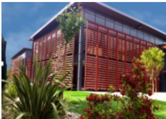
Les locaux à Toulouse

L'activité de R&D assure la veille technologique, l'évaluation de nouvelles solutions, le développement et l'intégration de nouveaux composants, ainsi que le prototypage de nouveaux services.